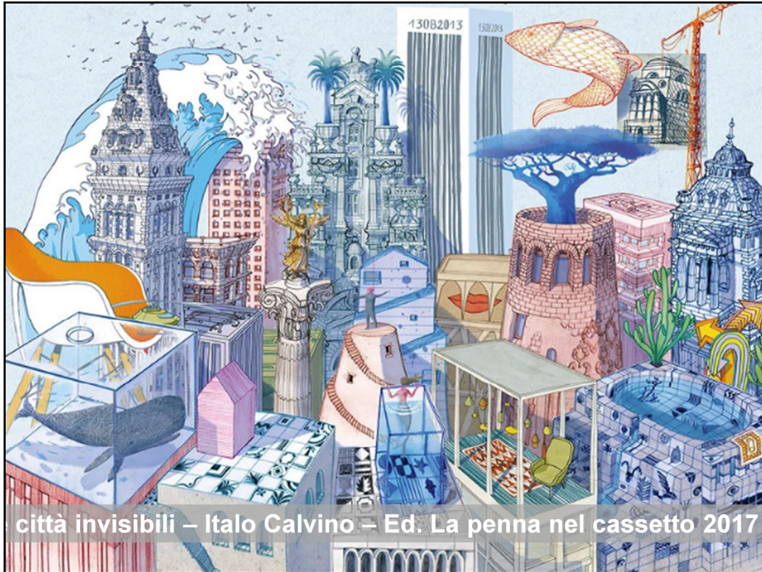
città invisibili – Italo Calvino – Ed. La penna nel cassetto 2017